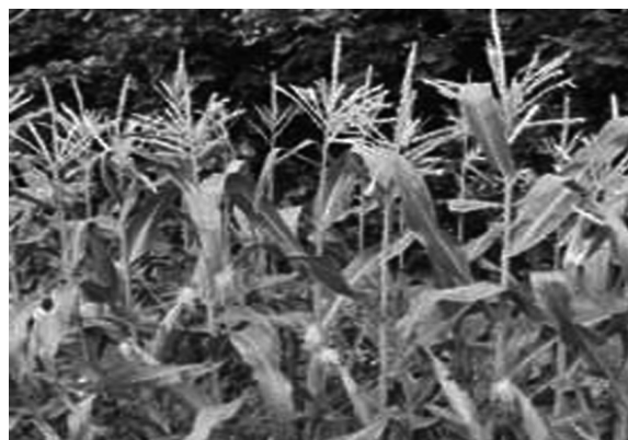
FIGURA 4. CULTIVO DE MAÍZ.

dejó de ser una actividad económica generadora de ingresos debido a que la mayor parte de su zona de bosques ha quedado deforestada, en la actualidad cuenta con escaso bosque de pino de ocote, que por suerte, se ubica en zonas altas de difícil acceso.