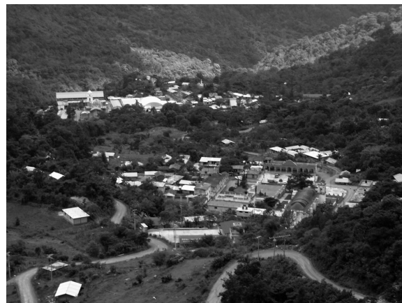
FIGURA 2. SANTA MARÍA YUCUHITI