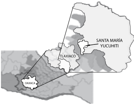
FIGURA 1. SANTA MARÍA YUCUHITI (PLANO DE LOCALIZACIÓN).

El nombre Yucuhiti proviene de dos vocablos mixtecos yucu=cerro y cuite=ocote, significa “cerro del ocote”. Es una comunidad rural enclavada en la sierra madre del sur. Se localiza en las coordenadas: latitud norte de 17° 01' con una longitud oeste de 97° 46' y a una altura de 1,740 metros sobre el nivel del mar en el estado de Oaxaca, México (Fig.1).