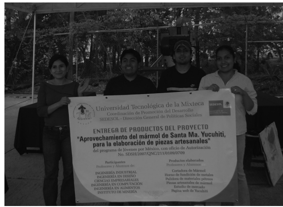
FIGURA 10A. ENTREGA DEL PROYECTO.

El proyecto se entregó el 15 de julio de 2008 ante autoridades municipales de Santa María Yucuhiti, de la delegación estatal de la Secretaría de Desarrollo Social y de la Coordinación de Promoción al Desarrollo de la Universidad Tecnológica de la Mixteca en una breve pero interesante ceremonia con la asistencia de la comunidad universitaria (Fig.10-A y 10-B).