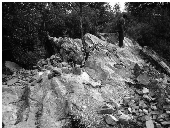
FIGURA 5. YACIMIENTO DE MÁRMOL.

En cuanto a la minería, es una actividad económica que no ha sido aprovechada eficientemente por la población, la piedra de mármol y la arenilla suelen utilizarlas como material común en la construcción