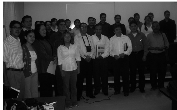
FIGURA 10B. ENTREGA DEL PROYECTO.