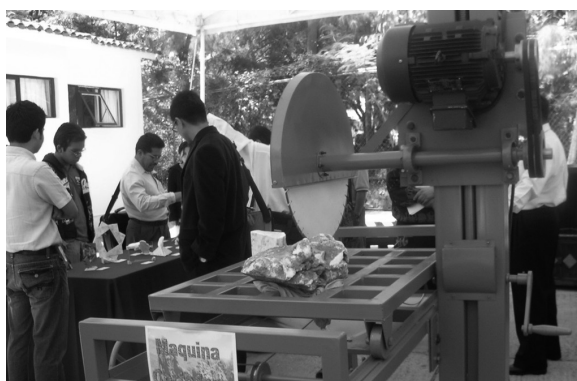
FIGURA 6. MÁQUINA CORTADORA.