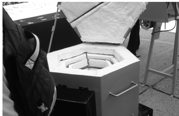
FIGURA 8. HORNO DE FUNDICIÓN DE ALUMÍNIO.

La organización social esta determinada por usos y costumbres o derecho consuetudinario (Cordero, 2001, ortízm 2006), el 9 de abril de 2007 se llevó a cabo su Asamblea General Ordinaria de elección popular de las autoridades civiles y religiosas para el periodo 2008-2010. Se renovaron 569 cargos en todo el municipio; 540 cargos que atienden a las 9 localidades, más 17 cargos en la presidencia municipal, más 12 cargos de la oficina federal de las tierras comunales.