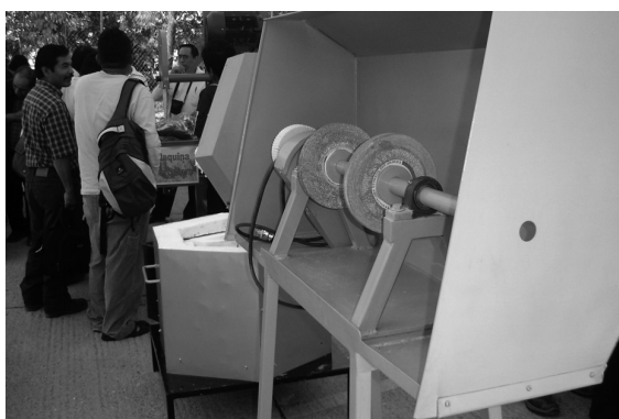
FIGURA 7. MÁQUINA PULIDORA.