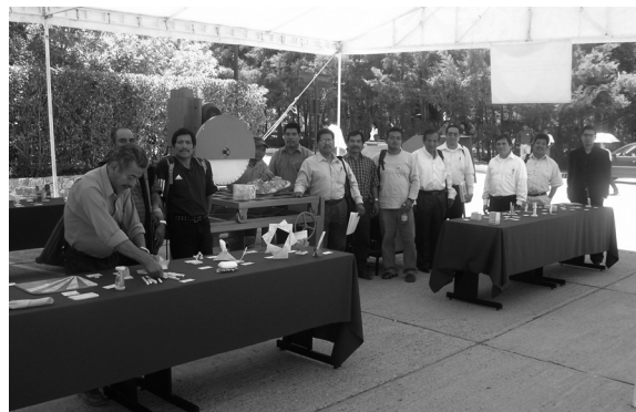
FIGURA 9A. ARTESANÍAS EN MÁRMOL.