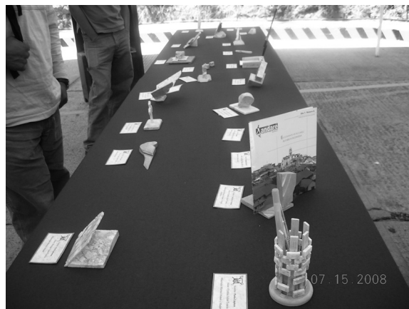
FIGURA 9B ARTESANÍAS EN MÁRMOL.