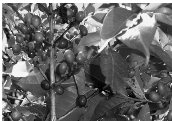
FIGURA 3. CULTIVO DE CAFÉ.

En forma secundaria se siembra calabacita, rábano, nopal, cilantro, cebolla, frijol y frutales. La ganadería, también es una actividad de escaso valor económico, generalmente de traspasío y sólo algunas familias poseen dos o tres cabezas de ganado vacuno, caprino, ovino, porcino y aves de corral (INEGI, 1994; Servicios de Saludo de Oaxaca, 2006). En cambio la actividad forestal